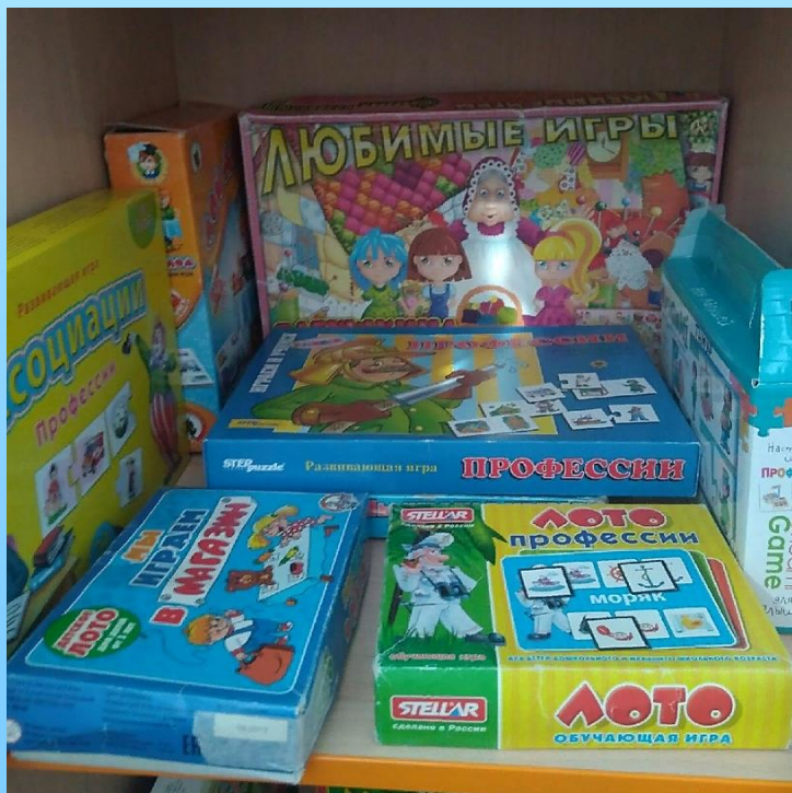
«Моя будущая профессия»