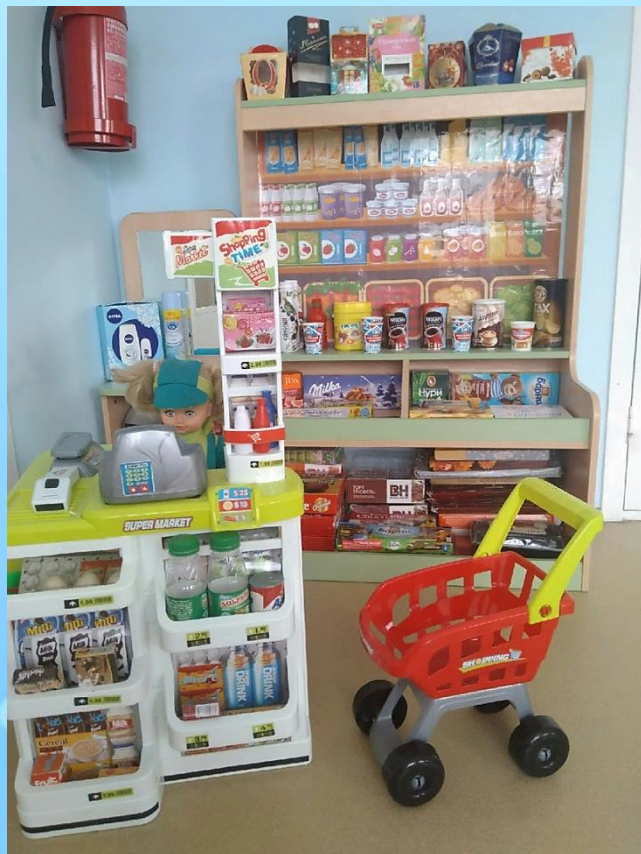
Магазин «Тысяча мелочей»